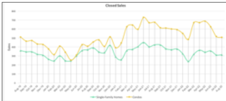
販売戸数の推移：Number of Sales

今年は、インフレ抑制のための大幅な利上げが4回も実施されたため、米国本土だけでなくオアフ島も戸建て・コンドミニアムともに販売戸数が急激に落ち込んでいます。需要は高いのですが、金利が昨年記録した最低利率の2倍以上に上昇しているため、特に一次取得者層の購入が難しくなっています。戸建てはグレートリセッション後の最低数の192戸、コンドミニアムはコロナ禍の2020年6月以来の最低数の340戸でした。